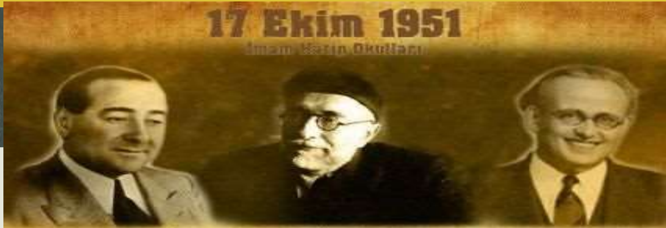
Adnan MENDERES Başbakan